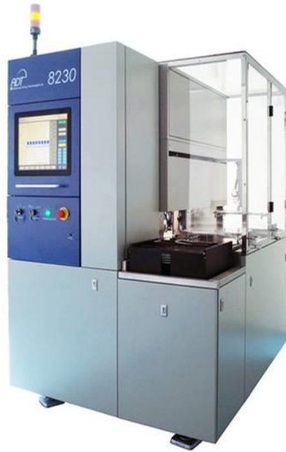
图 4-1 全自动双轴晶圆切割划片机-8230