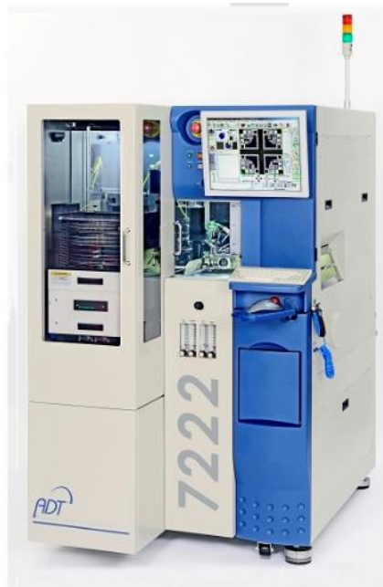
图 4-3 全自动 8 英寸&12 英寸 72XX-7222/7223/7224/7200-300