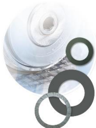
图 4-5 刀片示意图

刀片是半导体封测工艺中晶圆切割和封装体切割环节的一种关键耗材，刀片被空气主轴带动高速转动后直接作用于被切割材料上，刀片的质量及性能稳定性、刀片间一致性等也会直接影响最终的切割质量和产品一致性。公司的软刀类型包括镍刀、树脂刀及烧结刀，并可根据加工材料不同定制设计不同刀片；公司软刀在切割品质方面具有加工效率高、精度高、寿命长等特点，且刀片通用性较好，可适配国内外市场主流划片机。目前，公司软刀系列产品广泛应用于半导体晶圆和电子元件的加工，经过几十年技术迭代和应用积累，性能稳定可靠，在全球处于领先地位，客户认知度高。