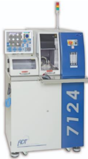
图 4-2 自动 8 英寸&12 英寸 71XX-7122/7124/7132/7134