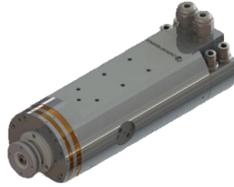
图 4-4 空气主轴示意图

切割用空气主轴可应用于多种材料的切削设备，可适配 2 英寸~4 英寸全系列刀片，转速为 40,000~60,000RPM，功率范围从 1.2 kW 到 2.5 kW；优化的水冷系统设计和制造技术使主轴寿命更长。